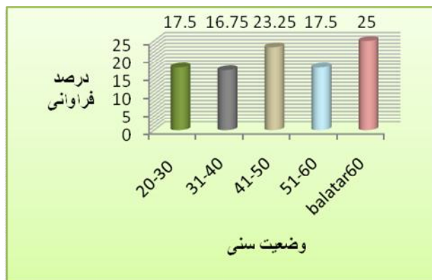
نمودار (۱) توزیع فراوانی سن نمونه‌ی پژوهش

بر اساس نتایج حاصل از داده‌های پژوهش، ۲۱۲ نفر از آزمودنی‌های تحقیق (معادل ۵۳ درصد)، مرد و ۱۸۸ نفر (معادل ۴۷ درصد) از آن‌ها زن بودند. بیشترین فراوانی در گروه‌های سنی ۳۱-۴۰ سال، ۹۳ نفر (معادل ۲۳/۲۵ درصد) و افراد با سن ۶۰ به بالاتر ۱۰۰ نفر (معادل ۲۵ درصد) بوده‌اند. (نمودار ۱) ۱۲۷ نفر از آزمودنی‌ها (معادل ۳۱/۷۵ درصد) اظهار داشته‌اند که در هفته یک روز ورزش می‌کنند، ۸۷ نفر (معادل ۲۱/۷۵ درصد) به میزان ۲ تا ۳ روز و ۹۶ نفر (معادل ۲۴ درصد) به میزان ۴ تا ۵ روز فعالیت می‌کنند. (نمودار ۲) ۸۴ نفر (معادل ۲۱ درصد) اظهار داشته‌اند که در روز به میزان ۱ ساعت، ۹۸ نفر به میزان یک ساعت و نیم (معادل ۲۴/۵ درصد) و ۱۱۲ نفر (معادل ۲۸ درصد) به میزان ۲ ساعت ورزش می‌کنند. ۵۰ درصد آزمودنی‌ها زمان فعالیت ورزشی خود را عصرها ذکر کرده‌اند و دلیل اصلی آن‌ها برای ورزش، کاهش وزن بوده است.